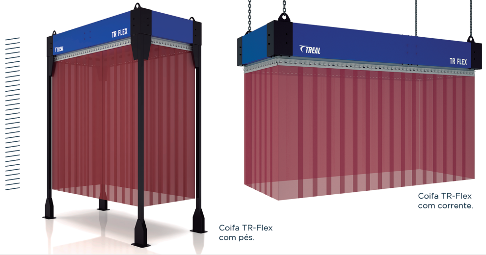
Coifa TR-Flex com pés.

Solução para captação de fumos de solda em robôs.